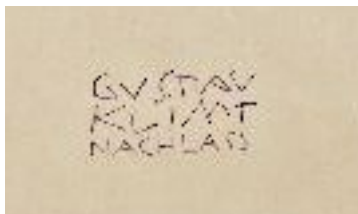
LM 1327 recto re. u.

Auf der Vorderseite der Zeichnung ist ein Nachlassstempel angebracht.